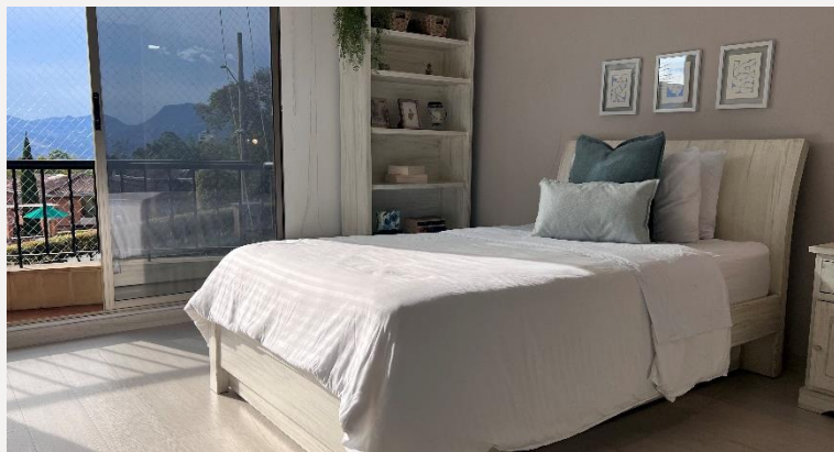
Habitación Auxiliar 1