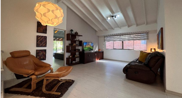
Sala Segundo Piso