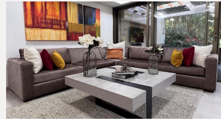
Sala Primer Piso