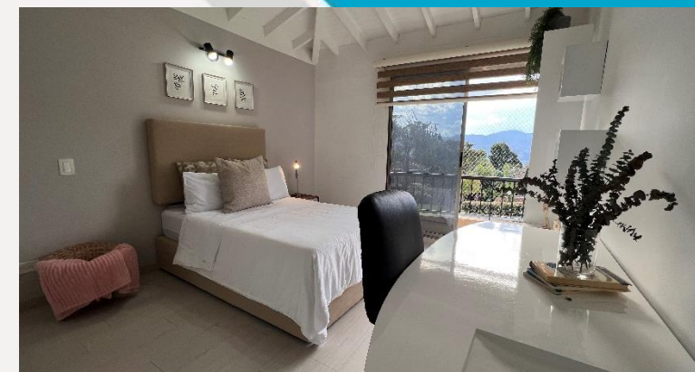
Habitación Auxiliar 2